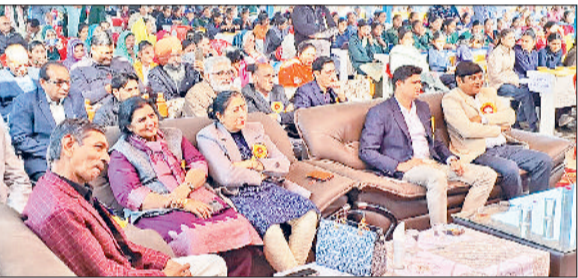
सिरसा। प्रशिक्षण कार्यक्रम में भाग लेते अध्यापक व विद्यार्थी।