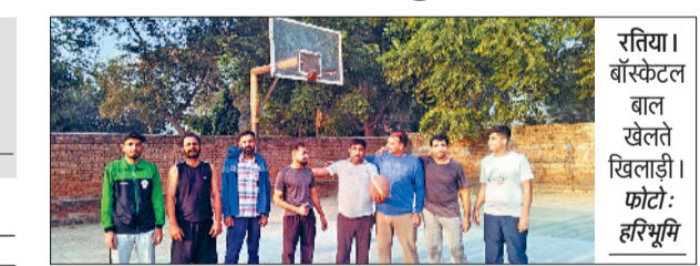
रतिया। बॉस्केटबाल खेलते खिलाड़ी।

पिछले दिनों रोहतक में एक खिलाड़ी की खेल विभाग की लापरवाही की वजह से बॉस्केट बॉल पोल खिलाड़ी के ऊपर गिरने से जो मौत हुई है, उसकी रतिया बॉस्केट बॉल टीम ने कड़े शब्दों में निंदा की और मृतक खिलाड़ी को श्रद्धांजली अर्पित की। रतिया बॉस्केट बॉल टीम ने सरकार व खेल विभाग से