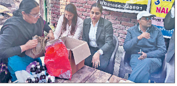
सिरसा। जागरूकता कैम्प में लोगों की जांच करते।

भाषाओं का मान-सम्मान करना चाहिए और अपनी शब्दावली को भी बढ़ाते रहना चाहिए। भाषाओं को जब हम पहचानते हैं, इतमें संवेदना, स्पंदन और जहां खुशियां जाहिर होती हैं, वहीं ज्ञान भी प्राप्त होता है।