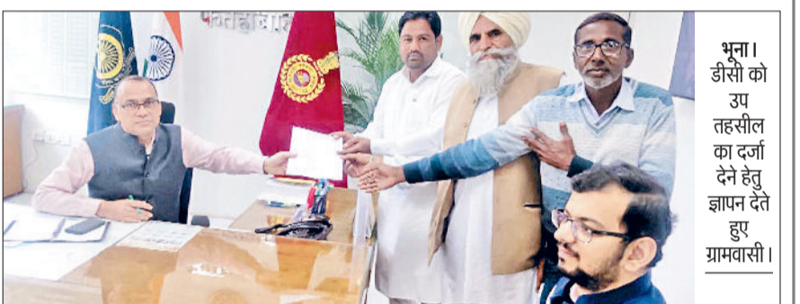
भूना। डीसी को उप तहसील का दर्जा देने हेतु ज्ञापन देते हुए ग्रामवासी।