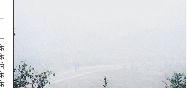
फतेहाबाद। सड़क पर छाई धुंध।

इन दिनों पहाड़ों पर हुई बर्फबारी के बाद उत्तर पश्चिमी हवाएं चलने के बाद 7 दिसंबर तक बादलवाड़ रहने की संभावना है। इससे दिन के तापमान में हल्की गिरावट व रात के तापमान में बढ़ोतरी होगी। इस दौरान हवा में बार-बार बदलाव होने के चलते वातावरण में नमी बढ़ेगी जिससे धुंध भी बढ़ सकती है। 8 दिसंबर से मौसम फिर करवट लेगा। उत्तर व उत्तर पश्चिमी हवाएं चलने से रात्रि तापमान में गिरावट आएगी। पिछले 24 घंटे में तापमान में 1.5 डिग्री सेल्सियस की गिरावट दर्ज की गई है। वीरवार को न्यूनतम तापमान 8 डिग्री सेल्सियस व अधिकतम तापमान 22 डिग्री सेल्सियस दर्ज किया गया। किसानों के अनुसार नवंबर माह में बारिश गेहूं की फसल के लिए अच्छी मानी जाती है। राय में एक के बाद एक पश्चिमी विक्षोभ तो आए मगर वह इतने कमजोर थे कि उनसे बारिश नहीं हुई। हालांकि बीते दो दिनों में बादलवाड़ जरूर छाई रही। वीरवार को अलसुबह हल्की धुंध के बाद दोपहर में मौसम लगभग साफ रहा। दिन में 11 किलोमीटर प्रतिघंटा की रफ्तार से हवाएं चली। मौसम विभाग ने किसानों और आम नागरिकों को सलाह दी है कि सुबह के समय कोहरे और ठंड से बचाव के उपाय करें तथा आवश्यक कार्यों के लिए दिन के समय ही बाहर निकलें।