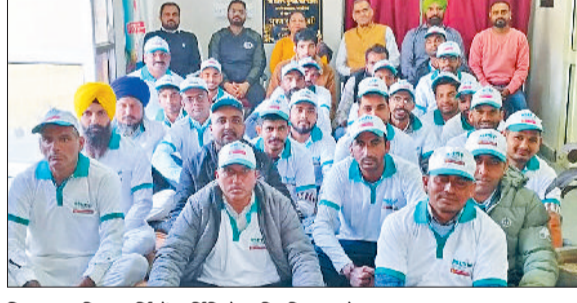
सिरसा। प्रशिक्षणार्थियों सर्टिफिकेट वितरित करते हुए।